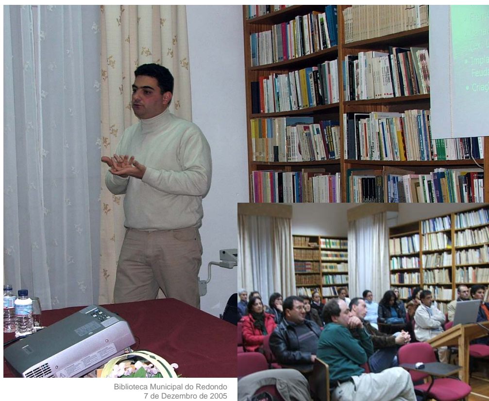
Biblioteca Municipal do Redondo 7 de Dezembro de 2005

Resta-nos agradecer às entidades locais por todo o apoio que nos deram na realização desta iniciativa.